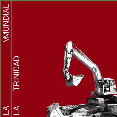
'La Mundial' (Single, 2020)