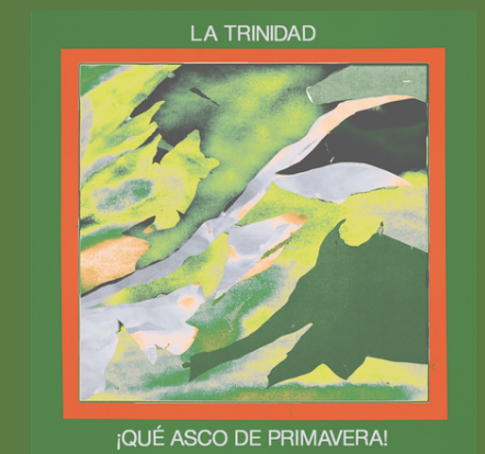
'¡Qué Asco de Primavera!' (EP, 2022)