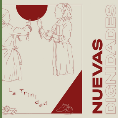
'Nuevas Dignidades' (EP, 2019)