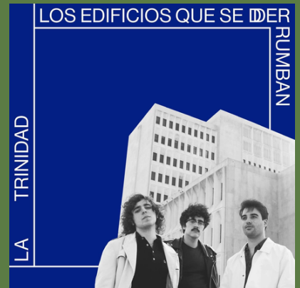
'Los Edificios que se Derrumban' (LP, 2020)