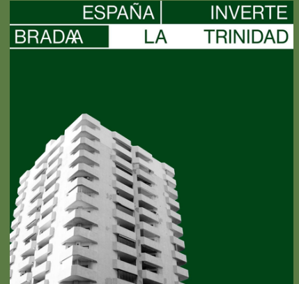
'España Invertebrada' (Single, 2020)