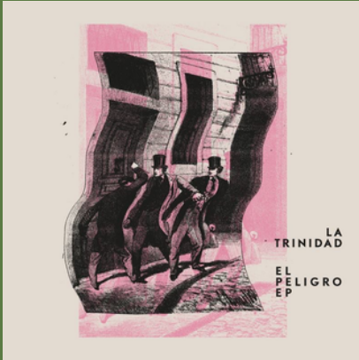
'El Peligro' (EP, 2018)