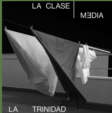
'La Clase Media' (Single, 2020)